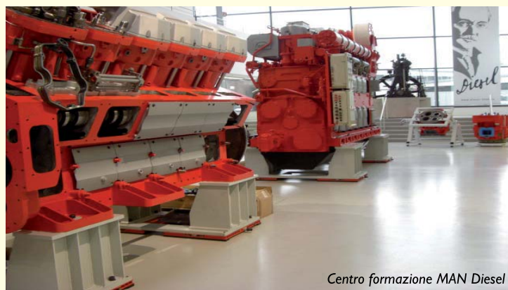
Centro formazione MAN Diesel